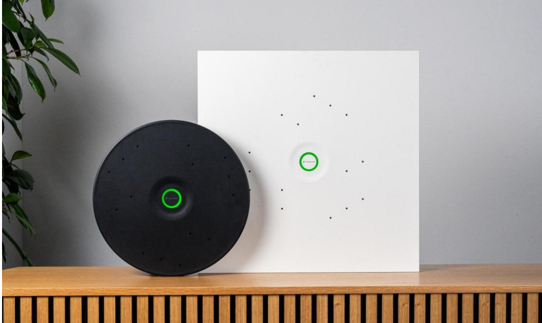
TCC M Plus 和 TCC M CT

随着混合办公和学习环境的不断发展，音视频系统正变得日益互联和复杂。TCC M Plus 通过将高品质音频表现与简化的安装、调试及管理相结合，专为应对这一变化而设计。